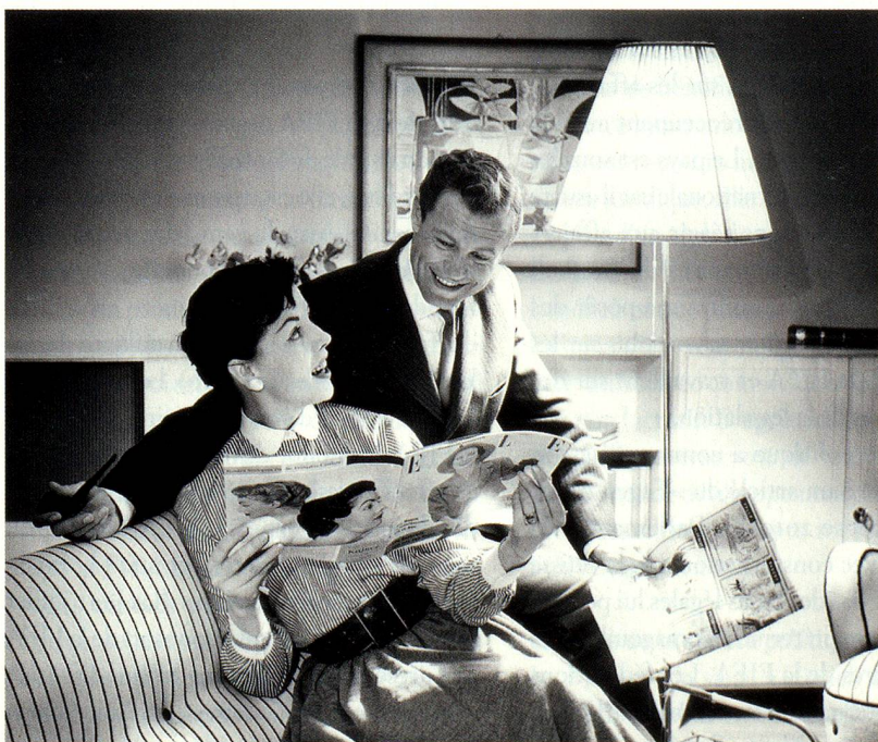
Couple modèle heureux, 1958, photo: Max Roth (sans titre)