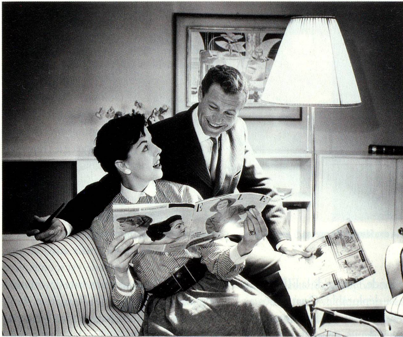
Chronologie de photos: Renault 4CV, publicité, vers 1964

«Schöner leben, mehr haben», Thomas Buomberger et Peter Pfunder; 267 pages; ISBN: 978-3-85791-649-6; prix: env. CHF 48.–