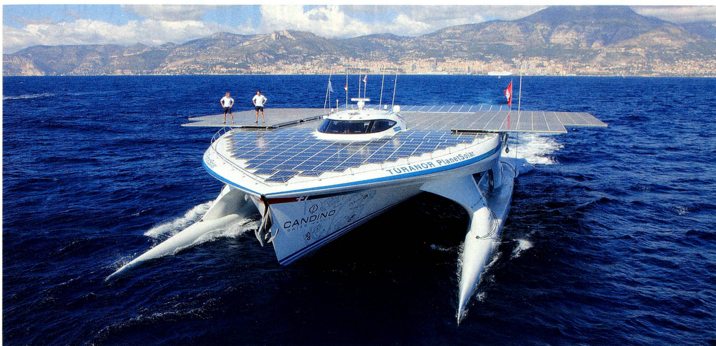
PlanetSolar devant Hong Kong en août 2011

teint Hong Kong en août 2011, où il reçoit un accueil extraordinaire. Le projet est notamment présenté à l'Université.