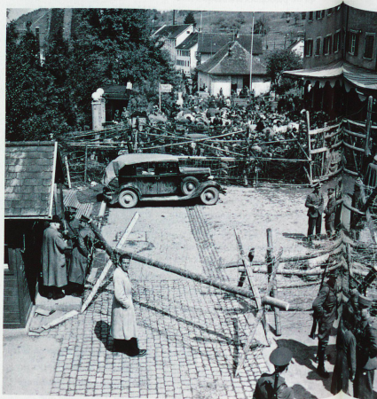
Réfugiés à la frontière de St. Margrethen, près de Saint-Gall, en mai 1945