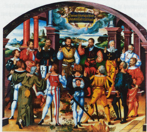
Le serment fédéral des représentants des 13 cantons, avec Nicolas de Flüe, devant à gauche. Le tableau d'Humbert Mareschet de 1586 est exposé à l'Hôtel de ville de Berne