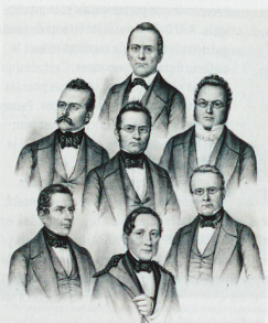
Premier Conseil fédéral en 1848. Au centre, le président de la Confédération Jonas Furrer; Josef Munzinger, Henri Druet, Wilhelm Matthias Naeff, Friedrich Frey-Hérosé, Stefano Franscini et Ulrich Ochsenbein (sens horaire en partant du haut)