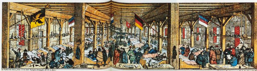
Großer Flüchtlings-Saal im Kornhaus in Bern, Januar 1850. Le Salon des réfugiés

«Schweizer Geschichte im Bild» [Histoire illustrée de la Suisse], édition hier+jetzt. Baker: 292 pages, 425 illustrations; ISBN 978-3-03919-244-1; CHF 78.-; EUR 60.-; www.hierundjetzt.ch