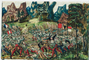
La bataille de Morgarten (1315) fut le premier conflit entre les Confédérés et les Habsbourg. Représentation dans la chronique illustrée de Christoph Silbersyren, 1576