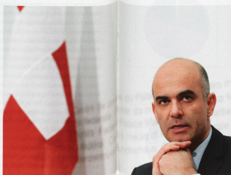
Alain Berset se présente pour la première fois à la présidence du Conseil fédéral.

Après avoir été réélue sans difficulté, Eveline Widmer-Schlumpf a été largement élue par le Parlement présidente de la Confédération pour l'année en cours. Ueli Maurer en est le vice-président. Didier Burkhalter est le nouveau chef du Département fédéral des affaires étrangères (DFAE). Depuis son élection au Conseil fédéral en 2009, le libéral-radical neuchâtelois dirigeait le Département de l'intérieur (DFI). Celui-ci a été repris par Alain Berset. Les autres cinq conseillers fédéraux continuent de diriger les mêmes départements qu'avant les élections.