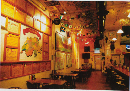
«The Original Baumgartner», cette taverne suisse et fromagerie du Wisconsin existe depuis 1931