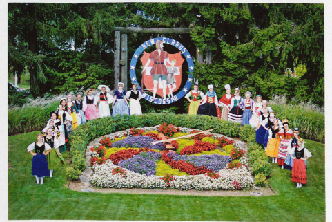
À New Glarus, fondé en 1845, beaucoup de traditions sont maintenues depuis des générations