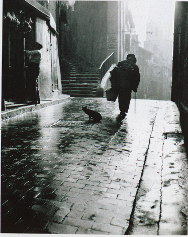
Ruelle à Marseille un matin de bonne heure

On oublie souvent que la Suisse a longtemps été une terre d'émigration. Dès le XVI e siècle et jusqu'au début du XX e , des centaines de milliers de Suisses ont quitté leur pays à cause de la croissance démographique et de la misère, en quête d'une vie meilleure autre part dans le monde. L'exposition sur l'émigration depuis Appenzell montre, avec des his-