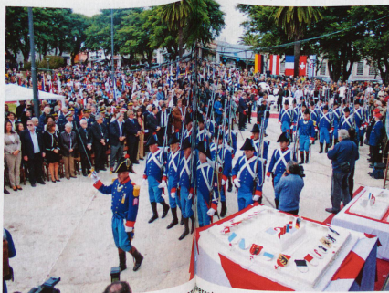
En 2012, défilés militaires pour fêter le 150 e anniversaire de l'immigration suisse en Uruguay, où vivent actuellement quelque 1000 Suisses de l'étranger