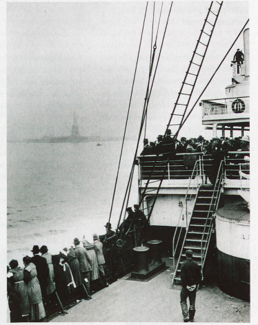
Émigrants sur un bateau devant New York, photo prise en 1915 par Edwin Levick

Exposition: «Appenzeller Auswanderung – Von Not und Freiheit» au Musée des arts et traditions populaires à Stein et au Musée des traditions à Urnäsch. Jusqu'au 27 octobre à Stein et jusqu'au 13 janvier 2014 à Urnäsch. www.appenzeller-museum-stein.ch ; www.museum-urnaesch.ch .