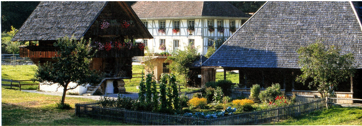
Ballenberg, le Musée suisse de l'habitat rural, Oberland bernois