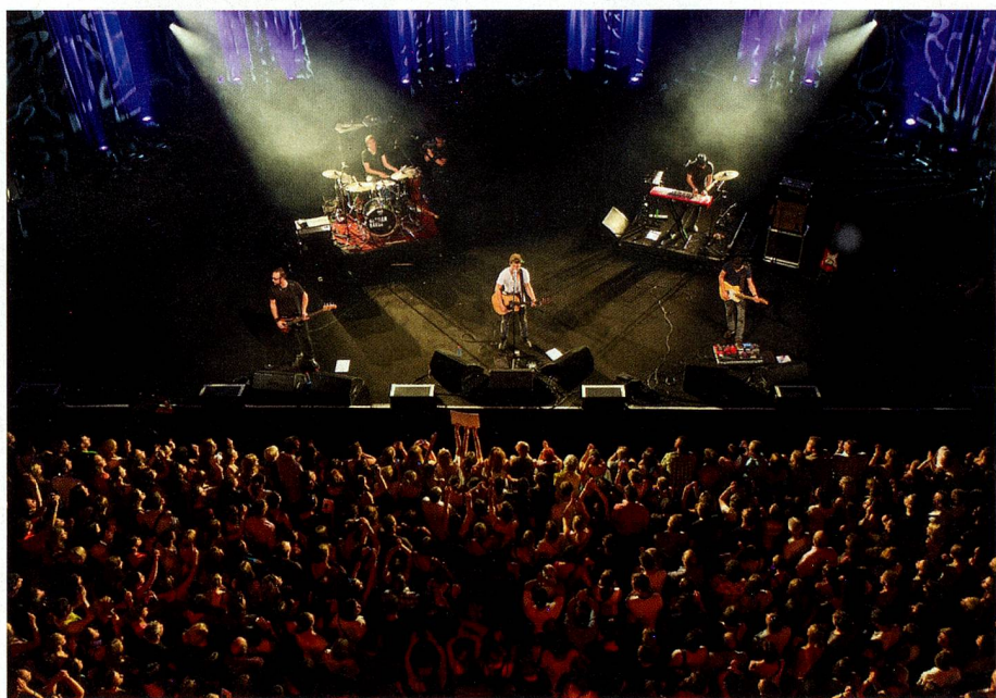
Lors d'une grande entrée sur scène à l'Auditorium Stravinski à Montreux

dois afficher clairement ses ambitions. «J'adorerais percer en Russie, parce que c'est un marché musical dont tout le monde se fiche en Suisse. Personne n'a envie d'aller faire carrière en Russie. Ce côté-là me séduit. J'aimerais pouvoir dire: je fais un stade à Moscou. Au-delà du succès de prestige de la France, le succès populaire d'une Russie, d'une Chine peut être très intéressant.»