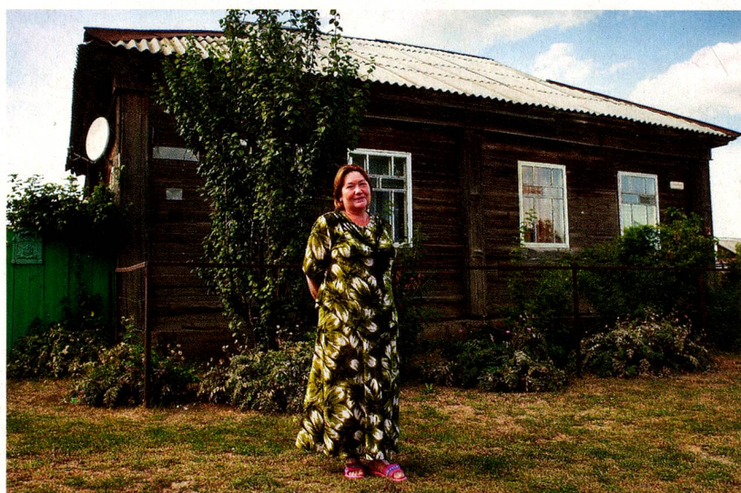
Zürichtal, aujourd'hui Zolotoe Pole: Ukraine Fondation: septembre 1805 Habitants: 4000 Population: Ukrainiens, Russes et Tatars de Crimée