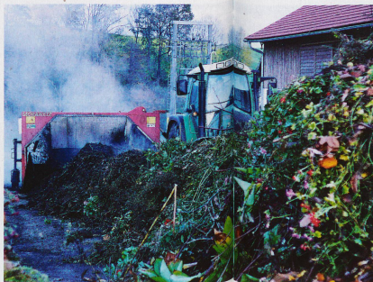
Éliminées correctement, les énormes quantités de déchets biologiques provenant du jardin ou de la cuisine sont transformées en humus pour les jardins