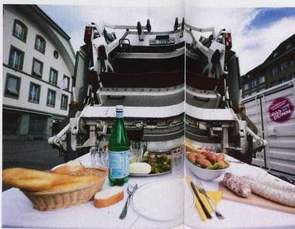
Environ un tiers de la nourriture finit en Europe parmi les ordures. Photo de l'exposition «food waste» à Bâle