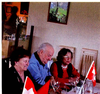
Au golf de Baden