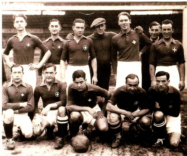
Le Onze helvétique de Paris il y a 80 ans.