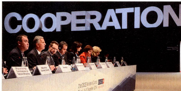
Table de la présidence dans la salle du Conseil ministériel

Pour tout renseignement complémentaire, consultez sur le site du DFAE le dossier consacré à la présidence suisse de l'OSCE: https://www.eda.admin.ch/eda/fr/home/aktuell/dossiers/osze-vorsitz-2014.html