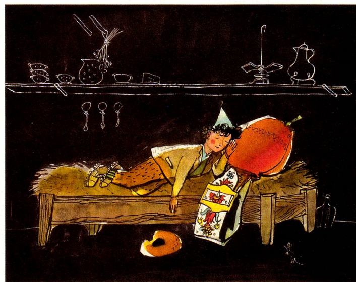
Extrait d'«Une cloche pour Ursli»