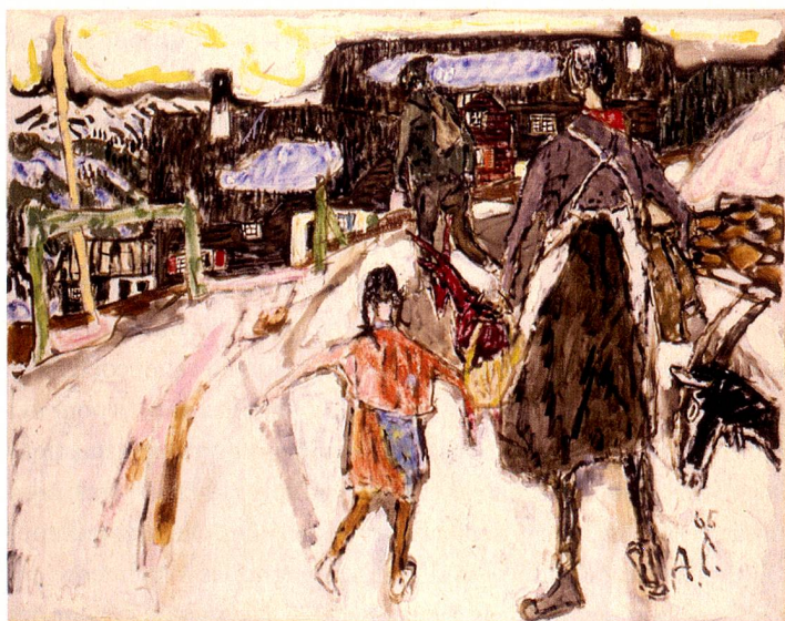
Famille de paysans à la montagne (1965), huile sur toile

Aujourd'hui, 30 ans après le décès d'Alois Carigiet (1902 – 1985) et pour le 70 e anniversaire d'«Une cloche pour Ursli», le Musée national suisse rend hommage à l'œuvre de Carigiet. L'exposition «Alois Carigiet. Art, graphisme et une cloche pour Ursli» rappelle que le peintre grison est considéré tant pour son œuvre de graphiste, scénographe et peintre que pour ses livres d'images. L'ouvrage «Alois Carigiet – Kunst, Grafik, Schellen-