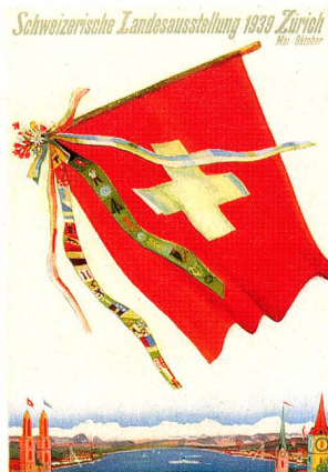
Affiche pour l'exposition Landi 39 à Zurich