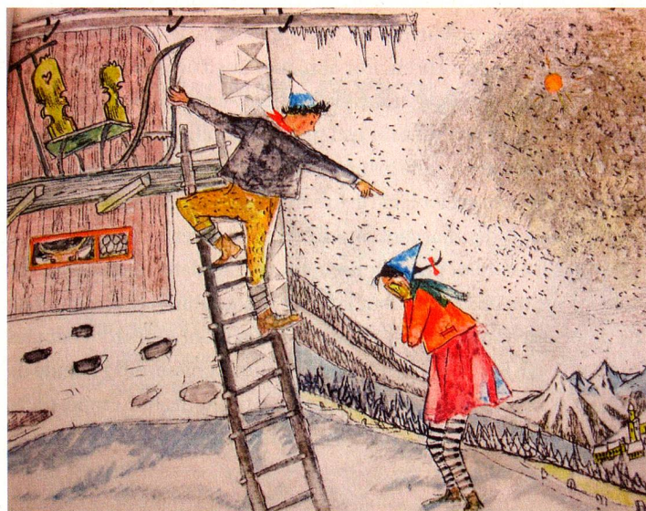
Extrait du livre «Florina et l'oisillon sauvage»