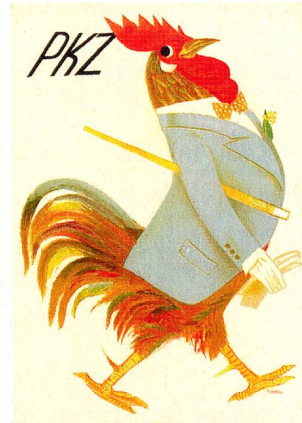
Affiche pour PKZ (1935)