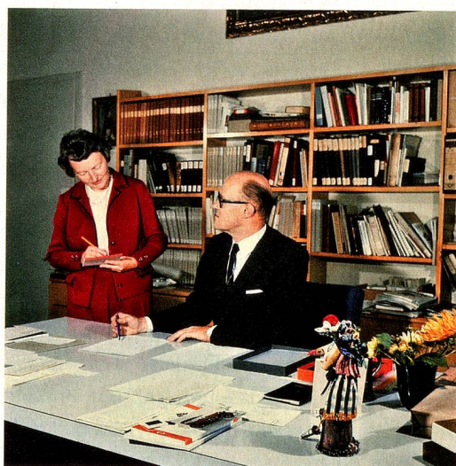
Le directeur du Musée national de Zurich avec sa secrétaire, 1975