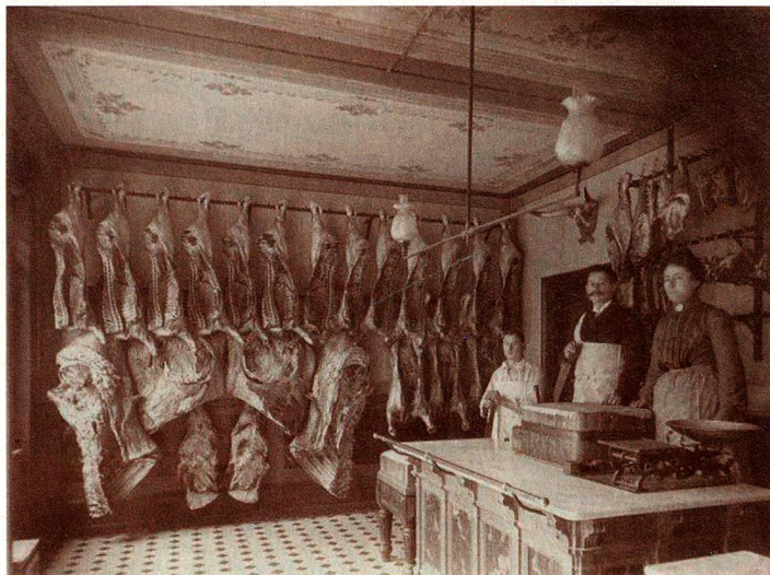
Le personnel de la boucherie Levy à Bâle, entre 1890 et 1910

et les travailleurs ont évolué. Des photographies sur le travail, prises entre 1860 et 2015, sont actuellement exposées au Musée national suisse à Zurich. Elles témoignent de manière saisissante des évolutions du monde du travail et de la relation des individus à leur travail.