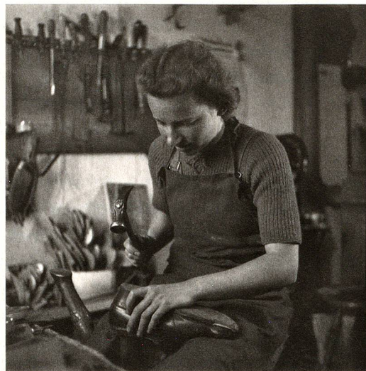
La première cordonnière de Suisse, à Lachen, en 1944