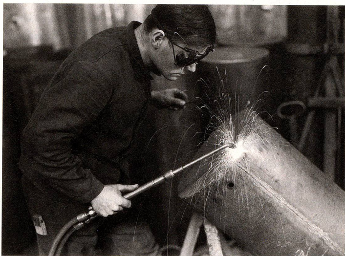
Soudeur, 1940, Frauenfeld

L'exposition au Musée national à Zurich dure jusqu'au 31 janvier 2016. Les éditions Limmat Verlag ont publié le livre de l'exposition intitulé «Arbeit – le travail»; 224 pages avec plusieurs articles et 218 photos; CHF 48.–, EUR 52.–. www.limmatverlag.ch , www.nationalmuseum.ch