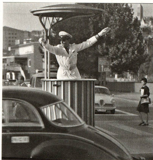
Agent de la circulation à Zurich, 1960