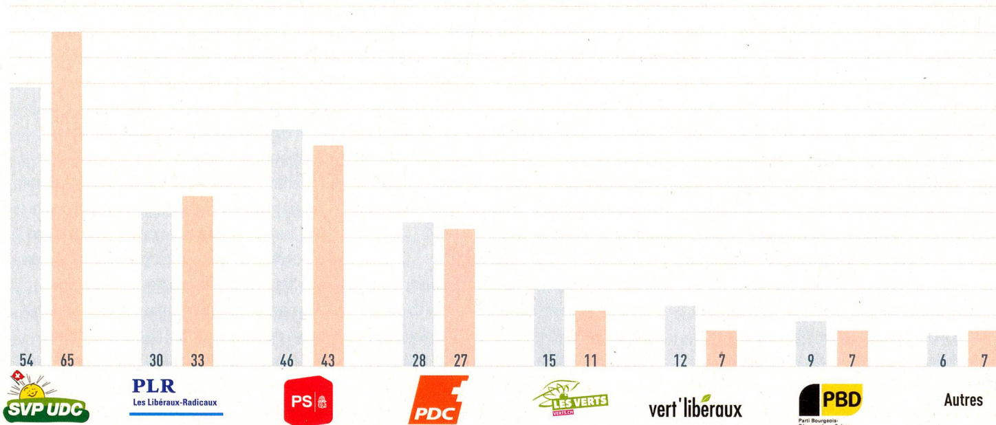
La répartition des sièges au Conseil national avant et après les élections du 18 octobre 2015

Face à ces résultats, il ne faut pas oublier que la Suisse a toujours été un pays traditionnellement bourgeois, avec une claire majorité bourgeoise, voire de droite. Autrefois, le paysage politique était dominé à force égale