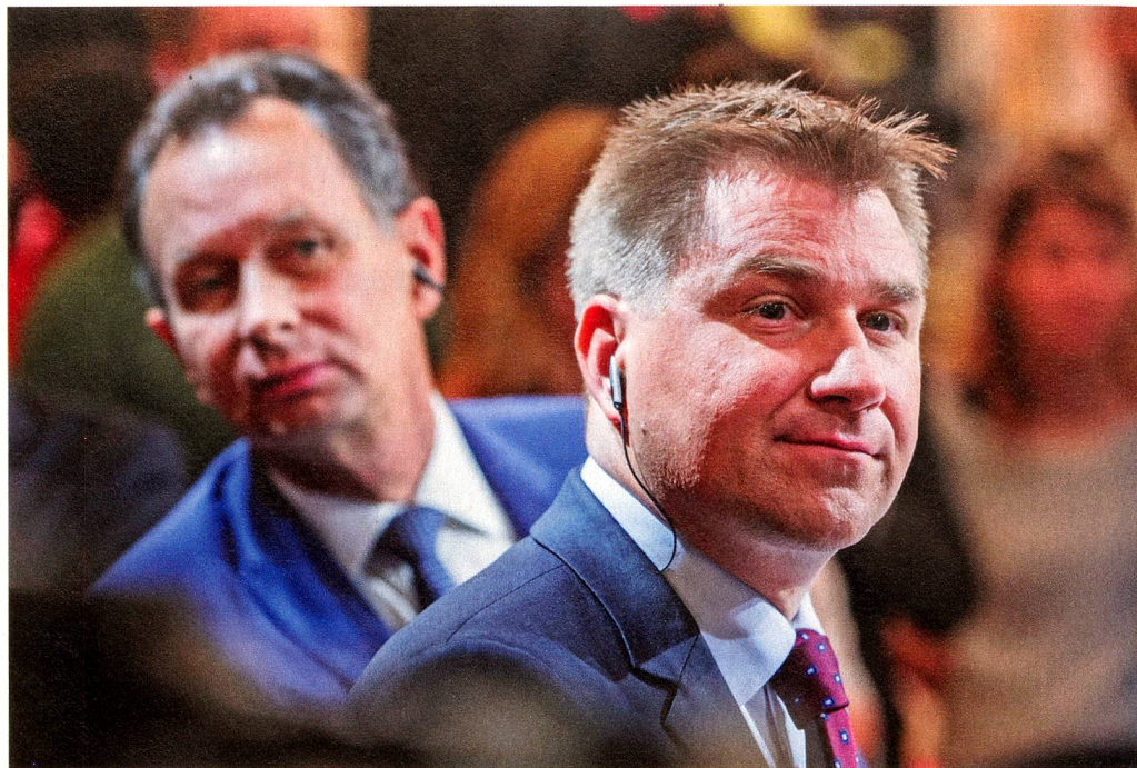
Les présidents des partis bourgeois dans l'attente des résultats: Toni Brunner, de l'UDC, devant Philipp Müller du PLR

■ Le PBD, le parti de la conseillère fédérale Eveline Widmer-Schlumpf, s'effondre également alors qu'il était