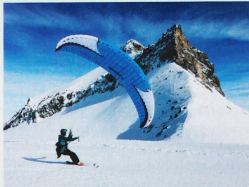
Le speed flying n'est autorisé que dans de rares régions