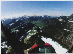
Parapentistes dans l'Alpstein

Voulez-vous voler en Suisse? Rien de plus simple, puisque le pays est truffé d'écoles de vol, de clubs et de pilotes commerciaux. Une journée d'essai avec un vol de 10 mètres coûte 120 francs, indique la FSVL. Le parapente exige un brevet, qui en général se déroule sur une année, l'idée étant de voler dans plusieurs types de conditions météo, selon cette fédération. La formation coûte environ 1800 francs et le matériel complet autour de 5000 francs. Voler sans brevet est interdit. Et la formation suisse est «poussée», estime Christian Jöhr.