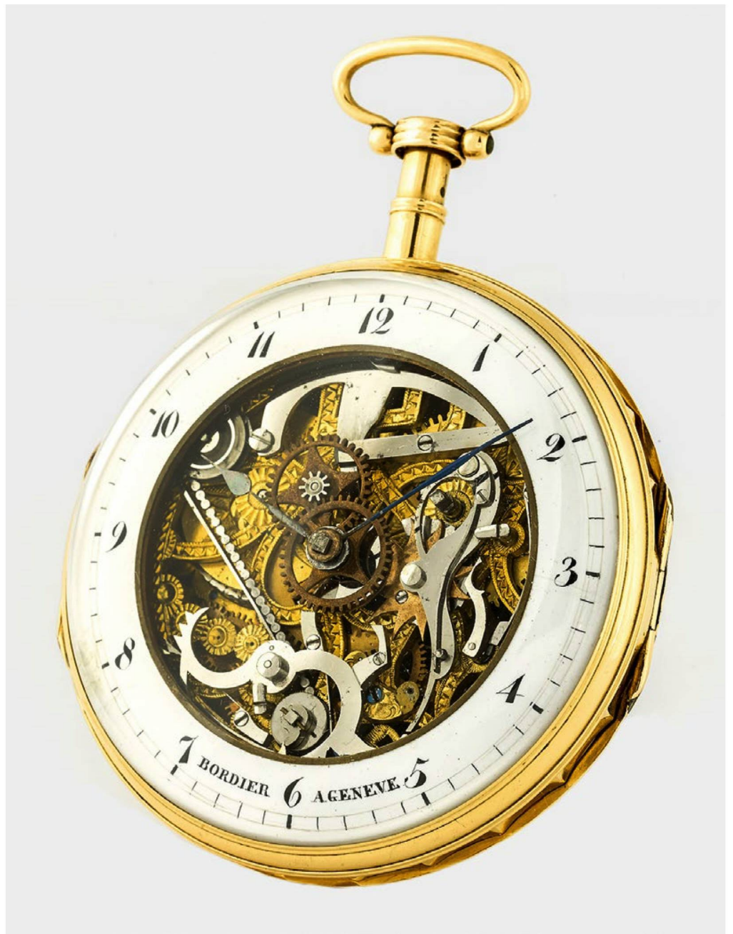
Montre de poche «squelette» des années 1820, conçue par Bordier à Genève.