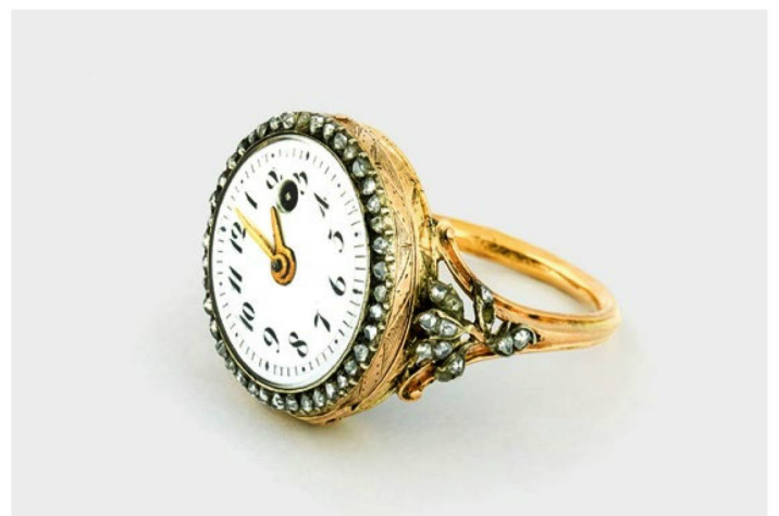
Vers 1790, il y avait aussi des bagues avec montre, comme le prouve cet exemplaire d'un horloger inconnu.