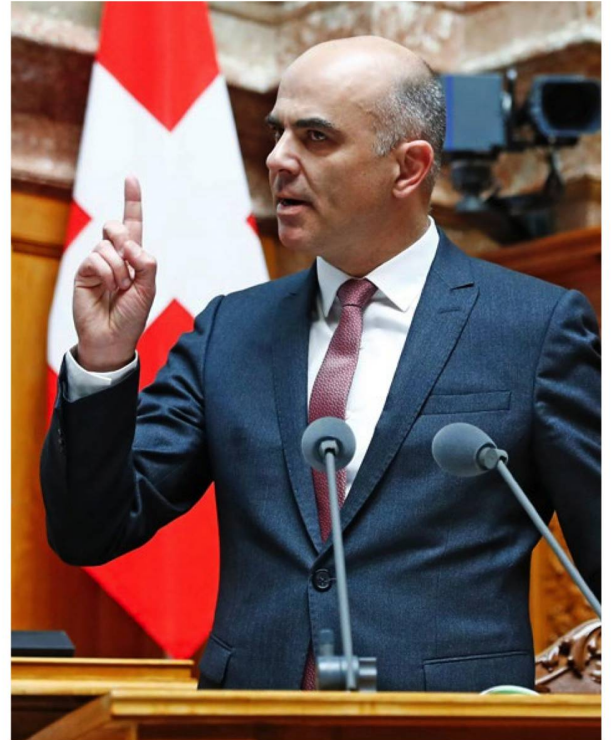
Le conseiller fédéral Alain Berset pourrait bientôt voir «sa» réforme des retraites adoptée.

Le ministre des Affaires sociales Alain Berset (PS) a maintenant l'opportunité, comme conseiller fédéral, d'entrer dans l'histoire comme l'artisan de la première réforme de l'AVS depuis les années 90, dotant aussi le 2 e pilier d'une base plus solide en baissant le taux de conversion, déterminant pour le calcul des rentes. En 2010, le peuple a déjà refusé à 72 % d'abaisser le taux de conversion. Berset pense qu'une réforme globale et simultanée des deux piliers a plus de chance d'aboutir. Mais tout reste à jouer pour le conseil-