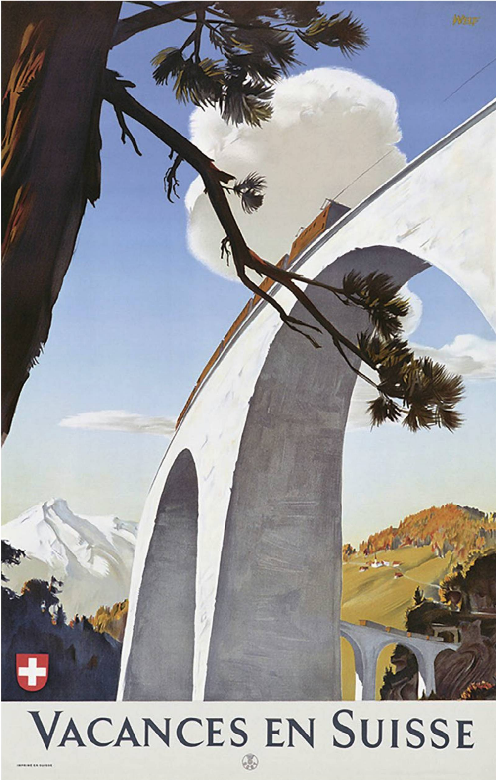
«Vacances en Suisse», 1946.