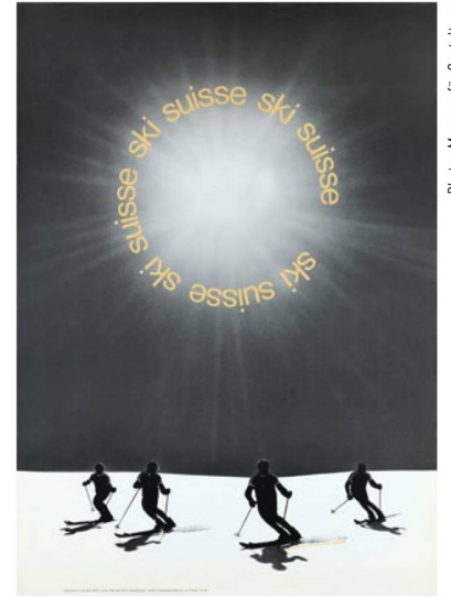
«Ski suisse», 1971.