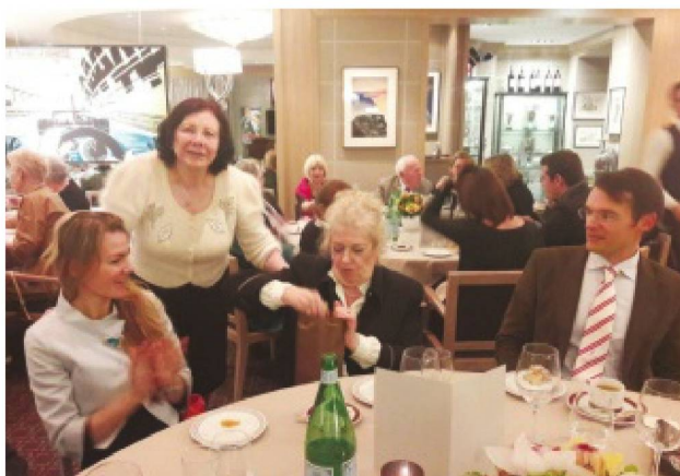
Club suisse de Monaco

TOUTE CORRESPONDANCE EST À ADRESSER AU CONSULAT GÉNÉRAL DE SUISSE À MARSEILLE.