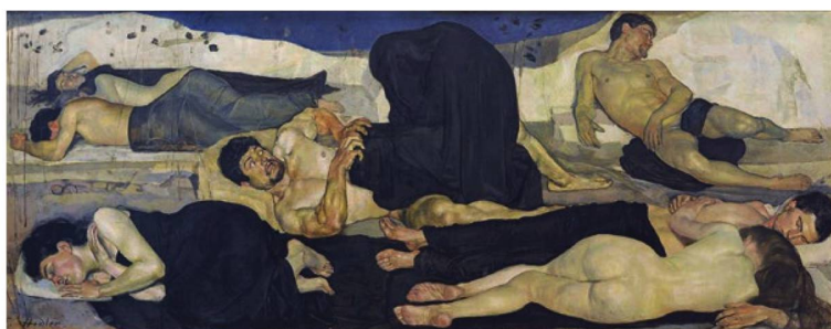
Ferdinand Hodler: «Die Nacht», 1889.