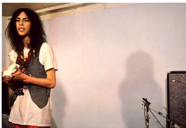
Franz Gertsch: «Patti Smith II», 1978.