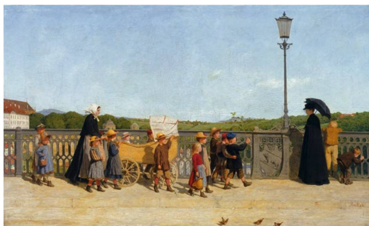
Albert Anker: «Kleinkinderschule auf der Kirchenfeldbrücke», 1900.