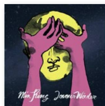
MIN KING: «Immer Wieder», Irascible 2017.

C'est tout simplement du jamais-vu: de la soul suisse, qui plus est en dialecte. Et non pas le substitut d'un folklore rutilant et aseptisé baptisé soul comme on le trouve depuis quelques années dans les charts. Non, une soul authentique issue du rhythm'n'blues de la fin des années 50.