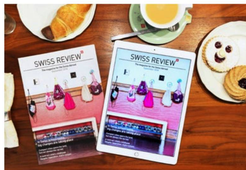
Que ce soit sur papier ou sur écran: le contenu de la «Revue Suisse» est toujours identique, quelle que soit sa forme.

■ Vous pouvez également envoyer un message à l'adresse suivante swissabroad@eda.admin.ch . Pour un traitement administratif simple de la demande de modification, les deux premières options sont toutefois préférables.