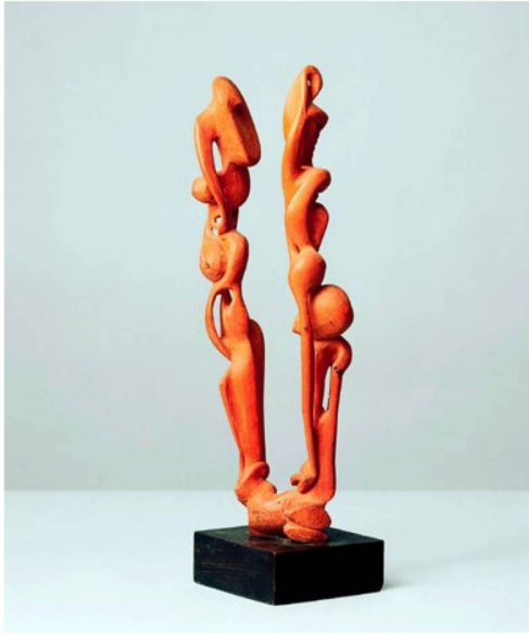
Serge Brignoni Érotique-végétal I, 1933, bois