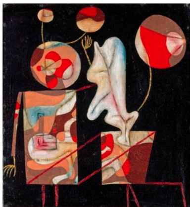
Paul Klee marionettes 1930, huile sur carton