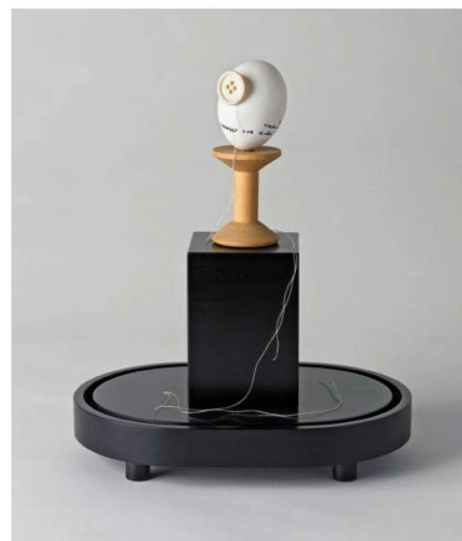
André Thomkins Tête d'œuf, 1973, coquille d'œuf, bouton, bobine de fil et fil