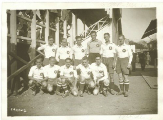
L'équipe fanion de l'USSP de Paris en 1929 devant son Stade de St-Mandé