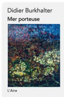
DIDIER BURKHALTER: «Mer porteuse». éditions de L'Aire, 2018, 194 p., CHF 24.-, EUR 24.-

Rédigé près du lac de Neuchâtel, «Mer porteuse», troisième ouvrage de Didier Burkhalter, offre une prose poétique sur fond d'interrogations consacrées à la filiation et à la force de nos origines familiales. Personnage à part entière de cette histoire d'enfant abandonnée: l'Atlantique, symbole de séparation, mais aussi trait d'union entre les humains. L'ancien conseiller fédéral possède une jolie plume, comme dans ce passage où les panaches de fumée d'un paquebot relient le navire au ciel «comme s'il avait peur d'être happé par les profondeurs.» Faiblesse? Une certaine paresse ou boursoufflure dans les formules, qui font que l'indifférence est forcément «crasse» et c'est évidemment un «océan de désespoir» qui submergera l'un des personnages du roman.