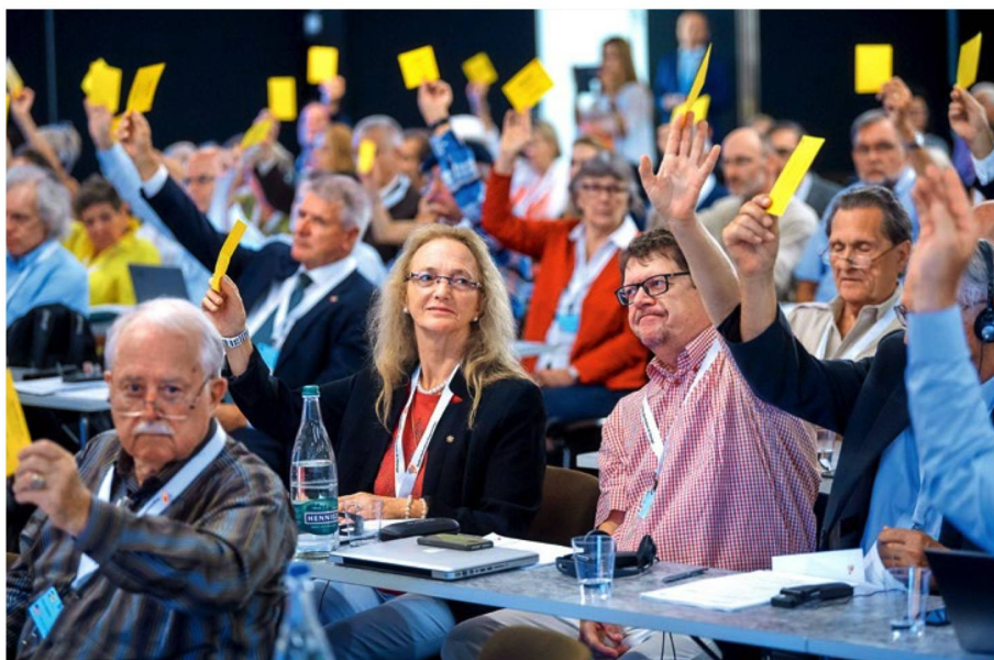
Signaux politiques à Montreux: fort de deux résolutions, le Conseil des Suisses de l'étranger demande au Conseil fédéral d'agir.

Le manifeste électoral approuvé par le CSE contient encore d'autres revendications politiques. Outre le point central, qui est de faciliter l'exercice des droits politiques des Suissesses et Suisses de l'étranger