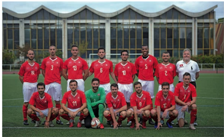
Equipe suisse au chômage technique