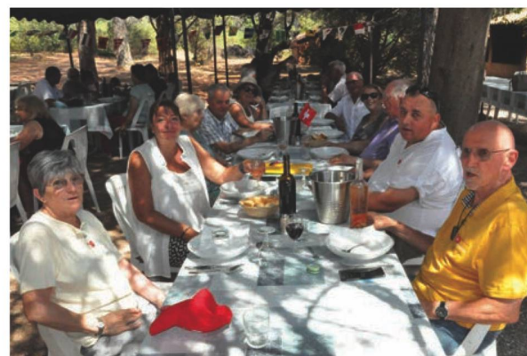
Amicale suisse du Var