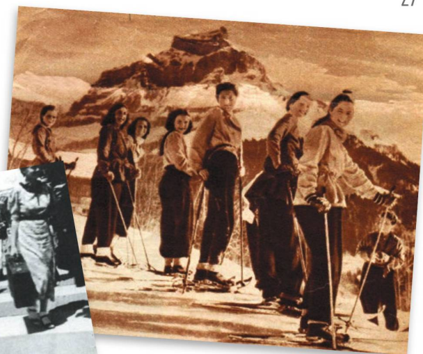
Souvenirs d'un camp de vacances de 1942: de jeunes Suissesses de l'étranger découvrent le ski à Engelberg.