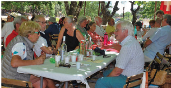
Helvetia Vaucluse Gard