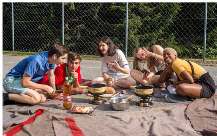
En 2019, encore sans masque et sans distanciation imposée, on se régalait d'une fondue au camp de sport et loisirs de Sainte-Croix.

En raison de la situation sanitaire dans le monde (pandémie du coronavirus), l'Organisation des Suisses de l'étranger a pris la difficile décision de réduire le nombre de camps prévus initialement en 2021. Elle organisera uniquement deux camps, un dans les Alpes vaudoises, l'autre dans les Alpes valaisannes. Le camp d'été aura lieu du 10 au 23 juillet 2021 à Château-d'Oex et le camp d'hiver du 27 décembre 2021 au 5 janvier 2022 à Grächen. Bien entendu, l'Organisation des Suisses de l'étranger suit de très près l'évolution de la pandémie dans le monde. Tout changement impactant l'organisation des camps sera indiqué sur le site internet: www.SwissCommunity.org .