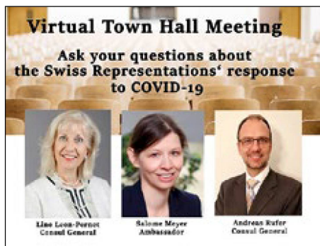
Les possibilités de la technique: Ottawa, Montréal et Vancouver étaient présents en même temps à l'«assemblée communale».

La pandémie de coronavirus a fortement restreint notre liberté de mouvement, mais elle a aussi élargi notre horizon. Compte tenu de l'ampleur mondiale de la crise, il est logique d'élargir son champ de vision ordinaire pour chercher ailleurs de bonnes idées pour le travail consulaire. Au Canada, nous avons été inspirés par les «discussions consulaires» de l'ambassade suisse en Thaïlande (voir article tout à gauche). Il s'agissait cependant, pour pré-