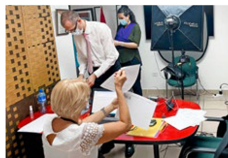
Un service très apprécié en raison des restrictions s'appliquant aux voyages: la station de passeport mobile, ici en tournée au Panama.

La prochaine manifestation se tiendra dans un format hybride: six collègues en charge des services consulaires dans nos six représentations d'Amérique centrale se rencontreront en chair et en os au Costa Rica et s'entretiendront virtuellement avec nos concitoyens. La manifestation aura