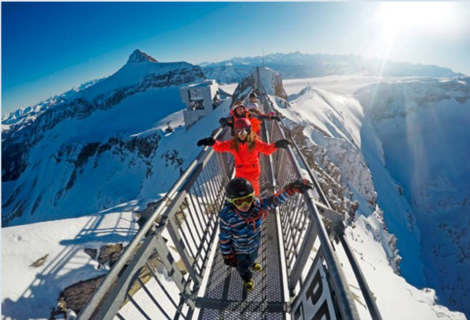
Un souvenir mémorable de camp de vacances: le passage sur le «Peak Walk», qui relie deux sommets.

Du 2 au 8 janvier 2023, des adolescents de 13 et 14 ans venant de toute la Suisse participeront à une semaine de sports d'hiver à la Lenk, dans l'Oberland bernois. 600 participants seront tirés au sort, et parmi eux 25 Suisses de l'étranger.