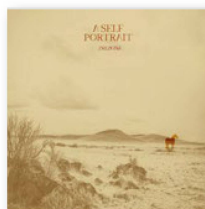
INEZONA: «A Self Portrait». Czar of Crickets, 2022.

Son nom évoque les paysages désolés et secs de l'Arizona. Une contrée semée de cactus géants et éblouie par un soleil de plomb. Inezona évoque aussi la culture de cette région, melting-pot d'influences occidentales et mexicaines. En Arizona, la musique country, americana et roots rencontre les sons des mariachis. On y chante tantôt en anglais, tantôt en espagnol. Souvent dans la même chanson.