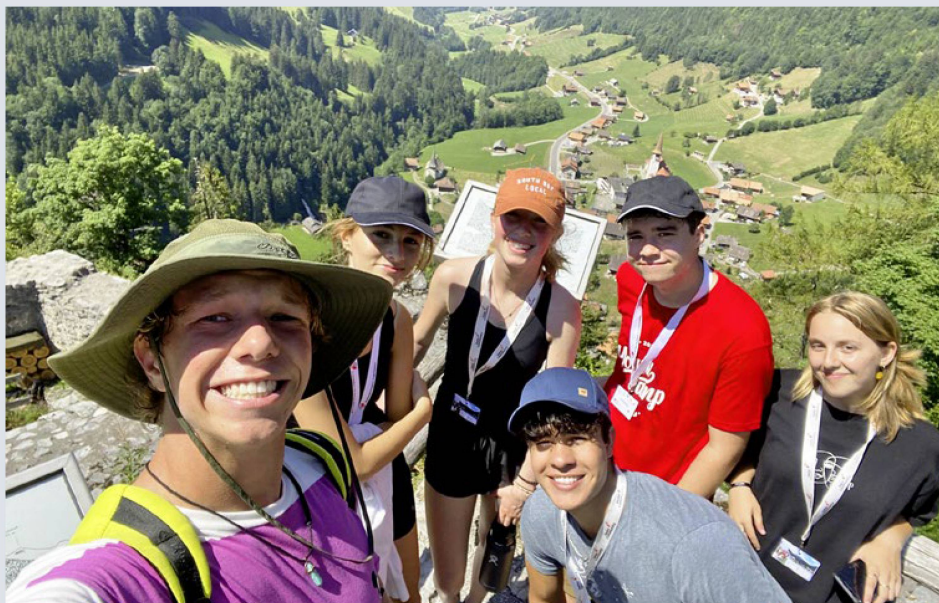
Après l'ascension, la vue est d'autant plus belle.

C'est la tête pleine de bons souvenirs des camps d'été de cette année qu'au Service des jeunes de l'Organisation des Suisses de l'étranger (OSE), nous préparons les offres pour l'année à venir. Nous pouvons d'ores et déjà vous annoncer que plusieurs camps de vacances d'été et d'hiver auront lieu en Suisse, tout comme le congrès en ligne, en collaboration avec le Parlement des Jeunes Suisses de l'étranger YPSA.