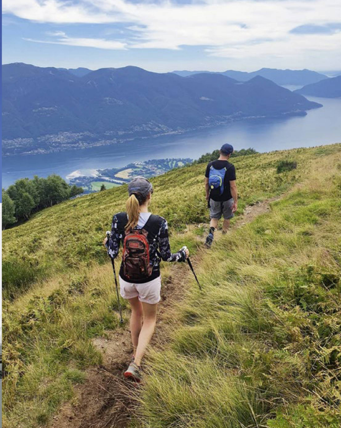
Autrefois très fréquentée l'hiver, la destination devient de plus en plus appréciée l'été. Presque tous les téléskis de Cardada Cimetta ont été démontés.

en Suisse, qui forment ensemble le réseau de mesures au sol SwissMetNet.