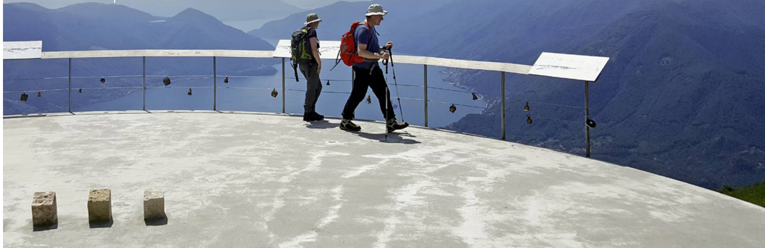
La plate-forme de tous les extrêmes: ici, sur la montagne des Locarnais, le soleil brille en moyenne 2256 heures par an. La terrasse est située à la jonction entre les plaques continentales d'Europe et d'Afrique.

Nul autre lieu en Suisse ne jouit d'un ensoleillement aussi important que Cardada Cimetta, au-dessus de Locarno. Cela attire les spécialistes de la recherche solaire. Petit tour d'horizon.