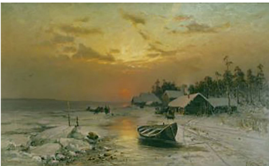
Youli Klever (Julius von Klever): Coucher de soleil hivernal. 1885. Huile sur toile.