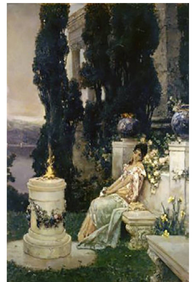
Wilhelm Kotarbinski: Près de l'autel. Non daté. Huile sur toile.