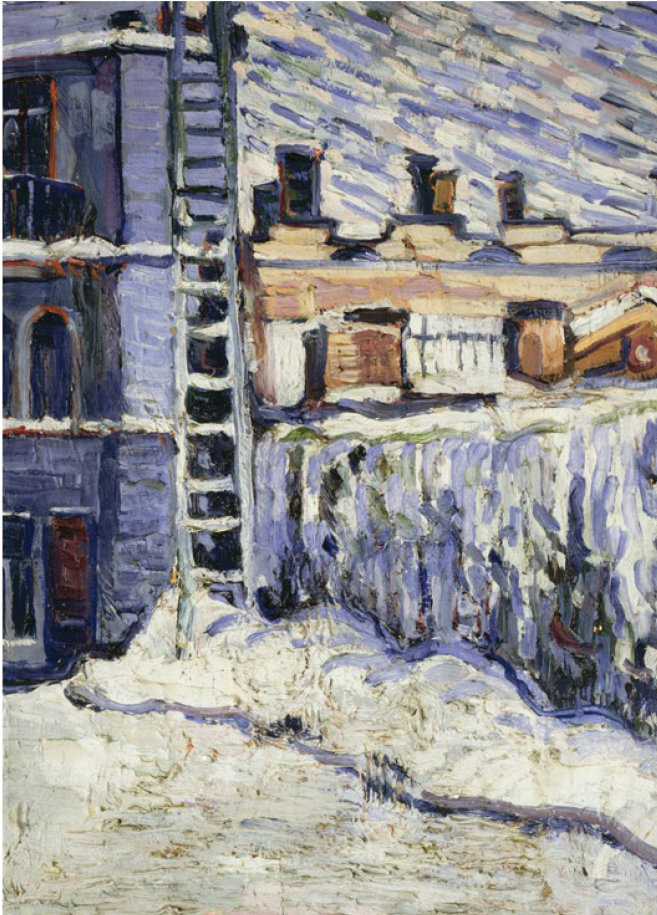
David Bourliouk: En ville, hiver. Non daté. Huile sur toile.