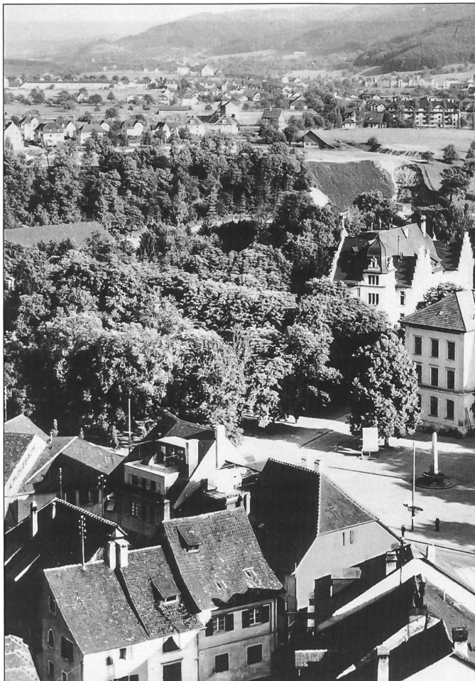
Abb. 10. Baden, Schulhausplatz vom Schloss Stein aus gesehen, ca. 1931. Blick in südöstlicher Richtung das Limmattal hinauf zum Kloster Wettingen. Das Wettingerfeld wird langsam überbaut.