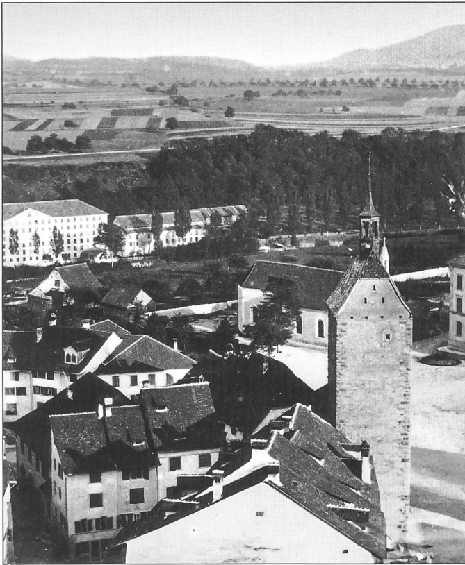
Abb. 9. Baden, Mellingerort und Schulhausplatz, ca. 1860. Am linken Bildrand die Spinnerei, erbaut 1835/37 durch Wild & Soliva (= erster Industriebetrieb in der Region, 1904 abgebrannt). Weitere markante Gebäude: Kapuzinerkirche (1875 abgebrochen), Schulhaus (1856 erbaut), Mellingerort (1874 abgebrochen).