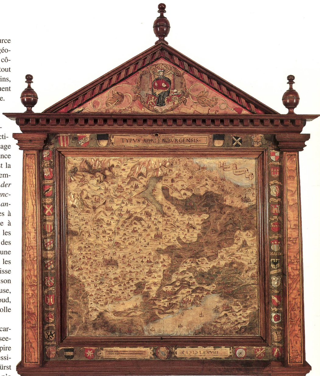
Fig. 14: TYPVS AGRI FRIBVRGBENSIS, la carte du canton de Fribourg de Guillaume Techtermann, 1578. Format 56,5 x 52,2 cm. Avec le cadre de bois décoré des armoiries des baillages: 70 x 70 cm (Archives de l'Etat de Fribourg).

Abb. 14: TYPVS AGRI FRIBVRGBENSIS, die Freiburger Kantonskarte von Wilhelm Techtermann, 1578. Kartenformat: 56,5 x 52,5 cm. Format des mit Wappen verzierten Holzrahmens: 70 x 70 cm (Staatsarchiv Freiburg).