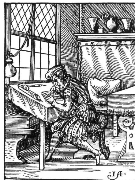
Abb. 17: Der Formschneider führte, aufgrund der Vorzeichnung durch den Reisser, den eigentlichen Holzschnitt aus. Dieser diente direkt als Druckträger. Holzschnitt von Jost Amman, Frankfurt 1568.

Fig. 16: La tâche du dessinateur était de reporter le dessin à l'envers sur le bloc de bois (planche de tilleul ou de poirier) ou sur la plaque de cuivre. Gravure sur bois de Jost Amman, Frankfurt 1568.