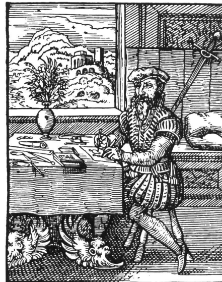
Abb. 16: Die Aufgabe des Reissers war, die Zeichnung des Kartographen seitenverkehrt auf die Holztafel (Linden- oder Birnbaumtrett) oder die Kupferplatte zu übertragen. Holzschnitt von Jost Amman, Frankfurt 1568.