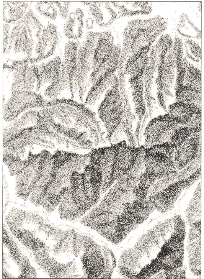
Abb. 68: Kreidelithographie.