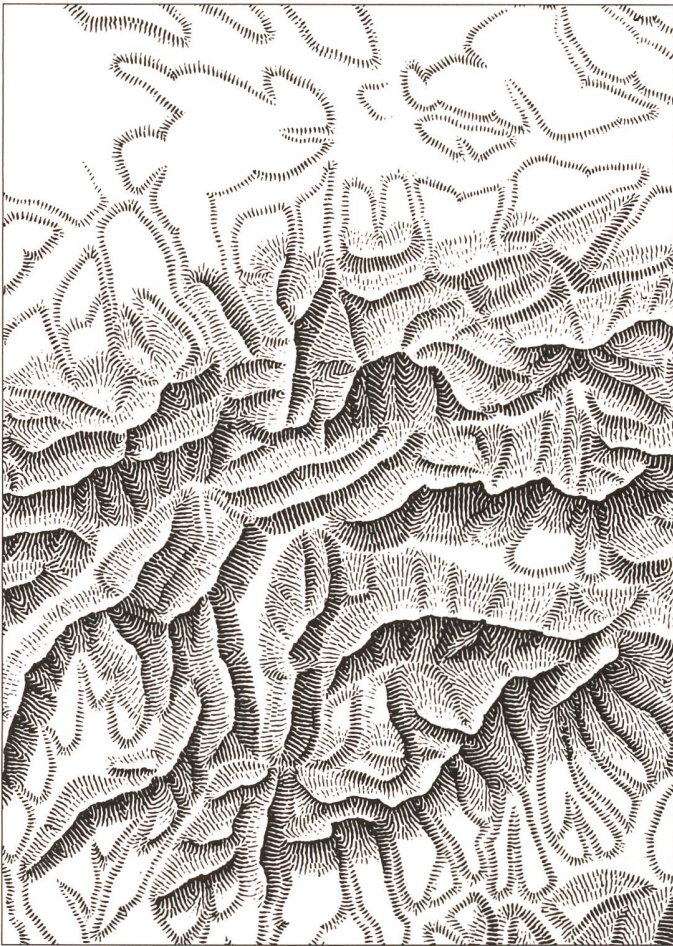
Abb. 67: Steingravur.