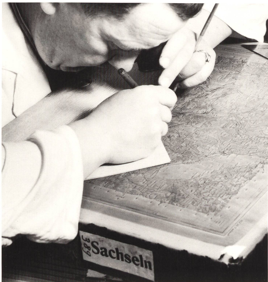
Abb. 66: Steingraveur.