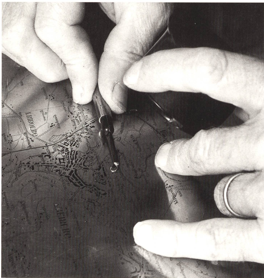
Abb. 65: Kupferstecher.

Aus dem Stein- oder Flachdruck entwickelte sich das Offsetdruckverfahren, das in der Eidgenössischen Landestopographie 1912 Einzug hielt.