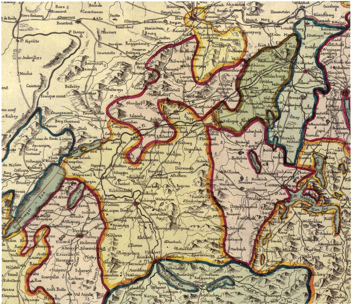
Abb. 4: Ausschnitt aus der 1801 bei Füessli & Comp. erschienenen Neuen Charte von Helvetien . Die Kantone tragen keine Namen, und ihre Grenzen sind nur mit einem Pinselstrich gezogen, nicht gestochen: Bei der Gebieteinteilung wurden weitere Änderungen erwartet. Abbildung auf 70 % verkleinert.