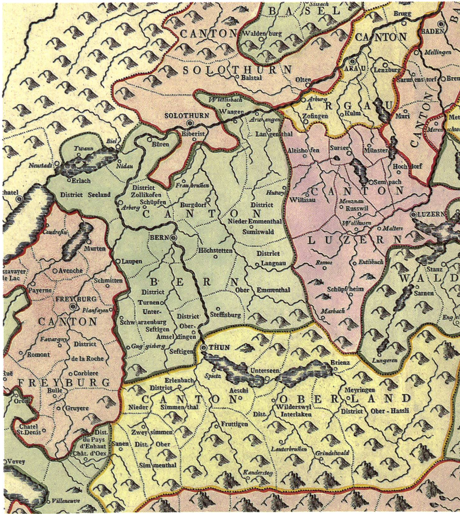
Abb. 2: Ausschnitt aus der typometrischen Karte der Helvetischen Republik von Wilhelm Haas, 1798. Mit der Verwendung von beweglichen Lettern im Landkartendruck (Typometrie) wurde eine Beschleunigung des Herstellungsprozesses von Karten angestrebt. Abbildung auf 70% verkleinert.

Gegensatz zu den beiden anderen zentralistischen Staaten föderalistisch bleiben würde. Als Hauptstädte waren Lausanne, Aarau und Schwyz oder Altdorf vorgesehen. Schon am 22. März wurde diese Proklamation aber widerrufen.