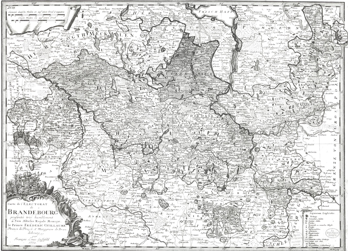
Nouvelle Carte géographique du MARGGRAVIAT de BRANDEBOURG dressée en six Provinces, savoir la Vieille Marche, la Moyenne Marche, la Marche Ultrasane & la Silésie qui après tout ensemble la Marche Electorale & la Nouvelle Marche ont été incorporées au Royaume de Prusse le 1 er Janvier 1773 par F. L. Goussier.