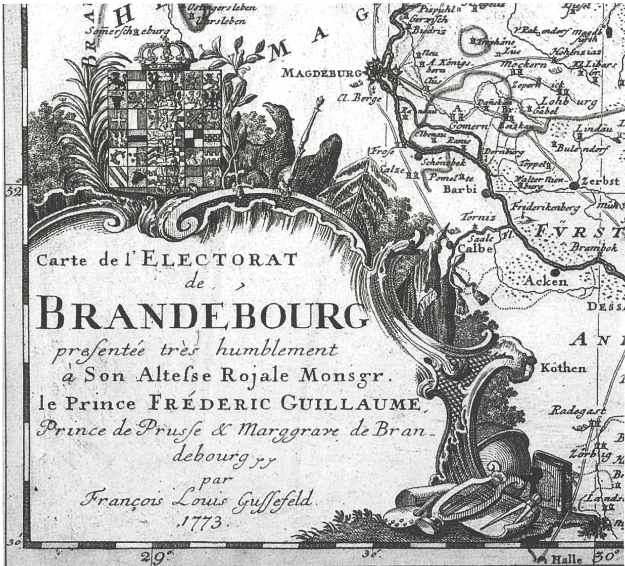
Abb. 2 Kartusche der Brandenburg-Karte von 1773 mit Leier und Malerpalette rechts unten.