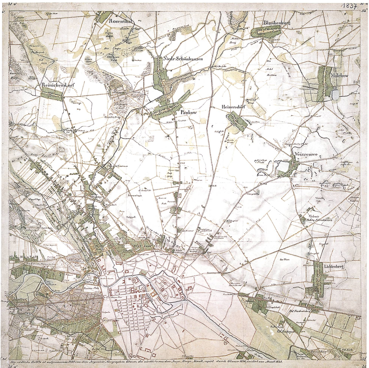
Abb. 2 Urmeßtischblatt Nr. 1837 Berlin. Aufgenommen 1825 von den Ingenieur-Geographen Glaeser und Maull. Revidiert 1835

Die Darstellung des Reliefs erfolgte zunächst mit Hilfe von Schraffen, ab 1846 durch Horizontlinien und ab 1867 durch äquidistante Höhenlinien. Die Maßeinheit war der Duodezimal-Fuß (60 Duodezimal-Fuß = 5 Preußische Ruthen).