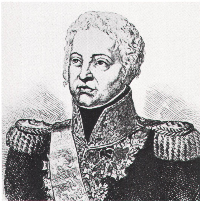
Alexis-Balthazar-Henri-Antoine, baron de Schauenburg

Drei Daten mögen die Geschichte dieser aussergewöhnlichen Dokumente erhellen: Im März 1798 werden diese Karten und Pläne behändigt und verbleiben im Besitz General Schauenburgs und seiner Nachfahren; im Dezember 1880/Januar 1881 werden sie durch die Eidgenossenschaft erworben und der Eidgenössischen Militärbibliothek einverleibt; im Frühjahr 1986 erfolgt der Beschluss, sie der Allgemeinheit zugänglich zu machen.