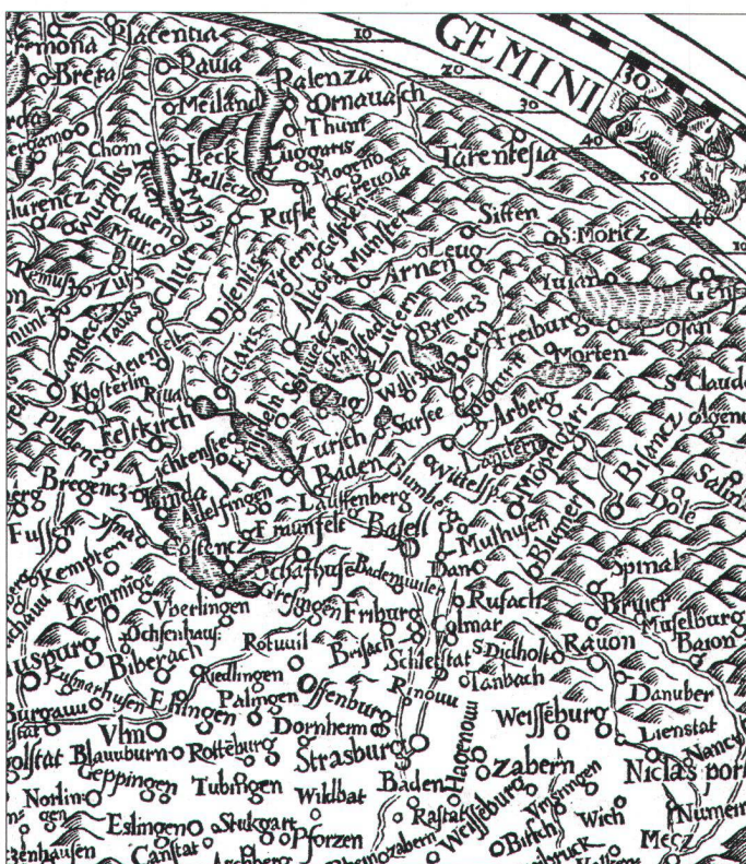
Abb. 3, links. Ausschnitt aus der Landkarte von Deutschland des Tilemann Stella (1560). Sie diente als Vorlage für die Ätzkarte von Andreas Plening.