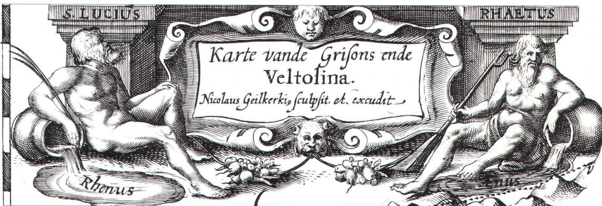
Abb. 4. (unten) Ausschnitt der Karte C1 von Geelkercken. Es sind die in der Ausgabe von Hattu (s. Abb. 3) fehlenden Namen S. Lucius , Rhaetus , Rhenus und Aenus ersichtlich sowie die angedoppelte Umrundungslinie bei der Minuteneinteilung der Längen- und Breitengrade abwechselungsweise für jeweils zwei Minuten neu angebrachten Schraffuren. (Diese sind auch bei allen anderen Ausgaben vorhanden.) Im weiteren ist zwischen den neu hinzugefügten Wörtern et. excudit der Buchstabe J des ausradierten Namens von Hattu teilweise noch erkennbar.