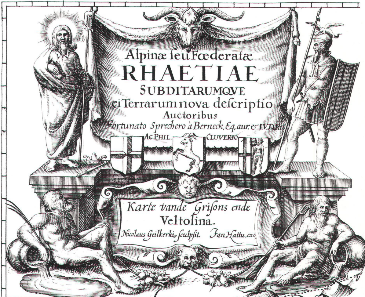
Abb. 3. Ausschnitt von Abb. 2 mit den Titelkartuschen. Der lateinische Titel, die Autorenangabe und die figürlichen Darstellungen entsprechen allen Ausgaben A bis E.