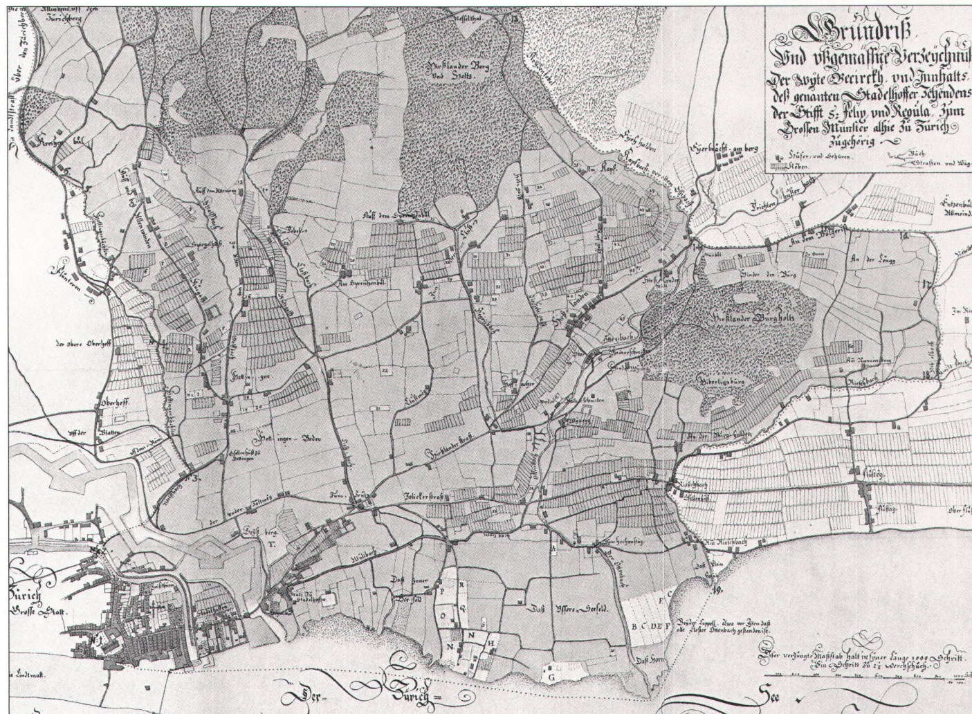
Abb. 4. Stadelhofer Zehntenplan von Hans Conrad Gyger, 1653. Ca. 1:6590, Format 71,3 x 56,6 cm (Staatsarchiv Zürich).

Der Aufbau des Stadelhofer- und des Flunterer Zehntenplanes ist derselbe. Das Zehntengebiet ist mit einem grünen Farbton dargestellt, die zehntenfreien Gebiete weiss und mit grossen Buchstaben bezeichnet. Die Grenze der Zehnten sind mit roten Punkten