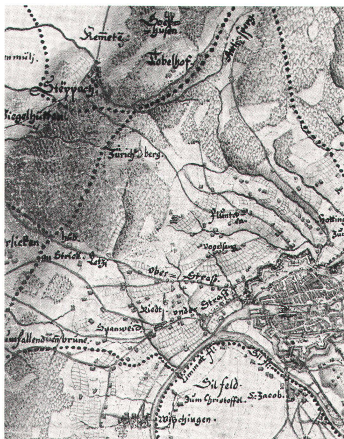
Abb. 8. Militärquartierkarte No. 1 von Hans Conrad Gyger, 1660. Ca. 1:45 000. Ausschnitt in Originalgrösse (Staatsarchiv Zürich).

Mittelalter gerodet, um grössere Nutzflächen zu gewinnen. Zudem brauchte man Holz zum Bauen, Kochen und Heizen. An den Grenzen der früheren Gemeinden Fluntern, Oberstrass und Schwamendingen, in Tobeln und auf den Höhenzügen blieb der Wald erhalten, weil die Arbeitswege mit dem Pferdefuhrwerk zu lang oder zu beschwerlich waren.