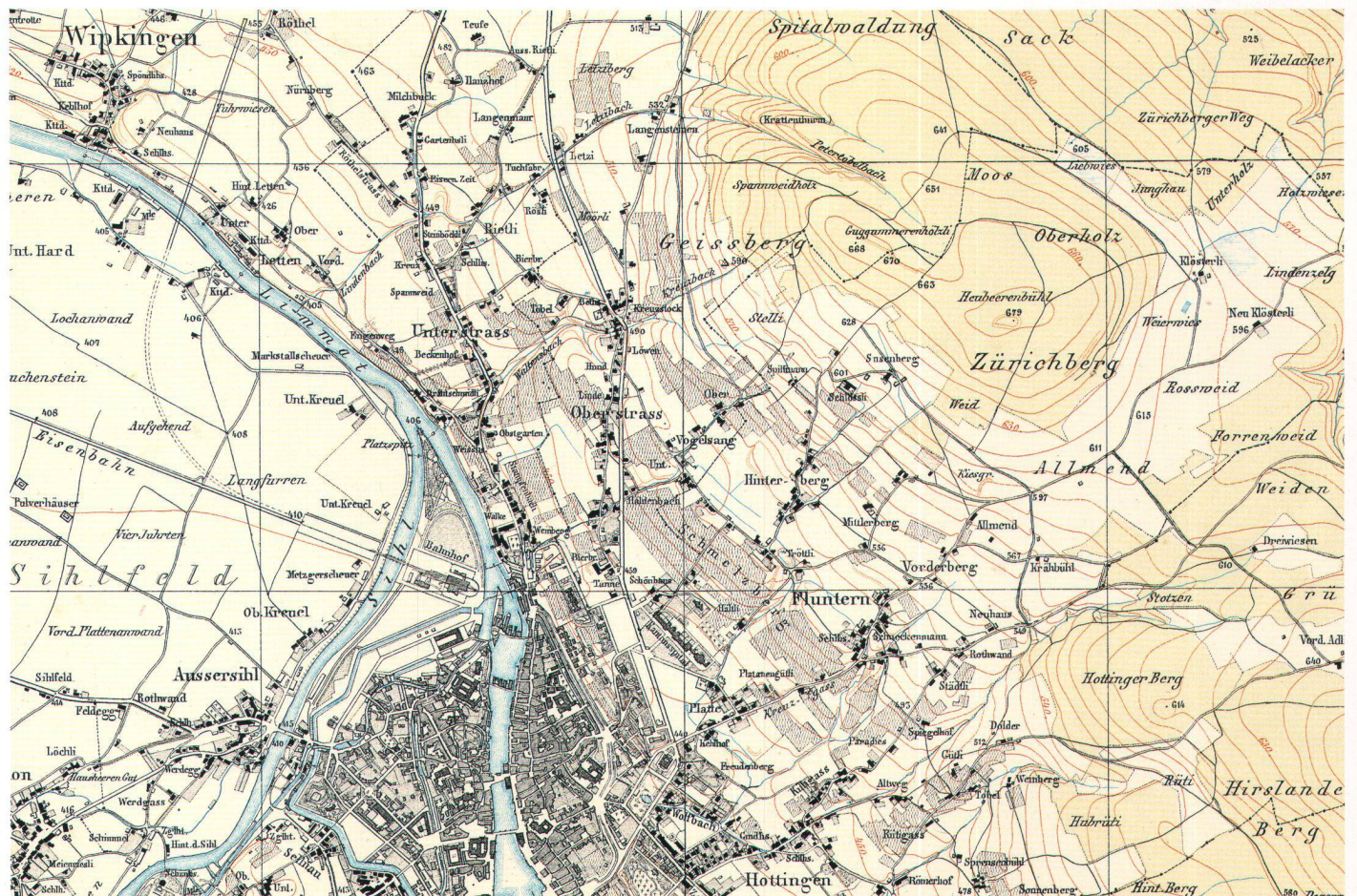
Abb. 7. Wild-Karte, 1854, 1:25 000, Ausschnitt aus Blatt XVIII, Zürich. Interessant ist der Vergleich der Rebberge und Wälder mit den Zehntenplänen, der Militärquartierkarte von H. C. Gyger (Abb. 8) sowie dem «Grundriss der Stadt Zürich» von Ing. J. Müller (Abb. 9).

Die Viehzucht hatte im 17. Jahrhundert eine geringe Bedeutung. Als Futterflächen standen nur wenige, meist nasse Wiesen zur Verfügung, dann auch zeitweise das Unkraut auf der Brache, die Wegränder, die Allmenden und die Wälder. Einzig nahe der Stadt hatte es gute Dauerriesen, die meistens mit Obstbäumen bepflanzt waren. Kleinbauern und Handwerker hatten keine Kühe, wohl aber einige Ziegen, die sie auf der Allmend, dem Geissberg, weiden lassen konnten. Der Milcherttrag war bescheiden, unter 1000 kg pro Kuh und Jahr, und die Milch hatte als Getränk viel weniger Bedeutung als heute. Im Gebiet unterhalb des heutigen Rigiblickes, wo der Zürichberg am steilsten ist, entstanden immer wieder Rutschungen. Die Sandstein- und Mergelschichten bewegten sich langsam talwärts, so dass Rutschwülste entstanden. In regenreichen Jahren kroch der Hang