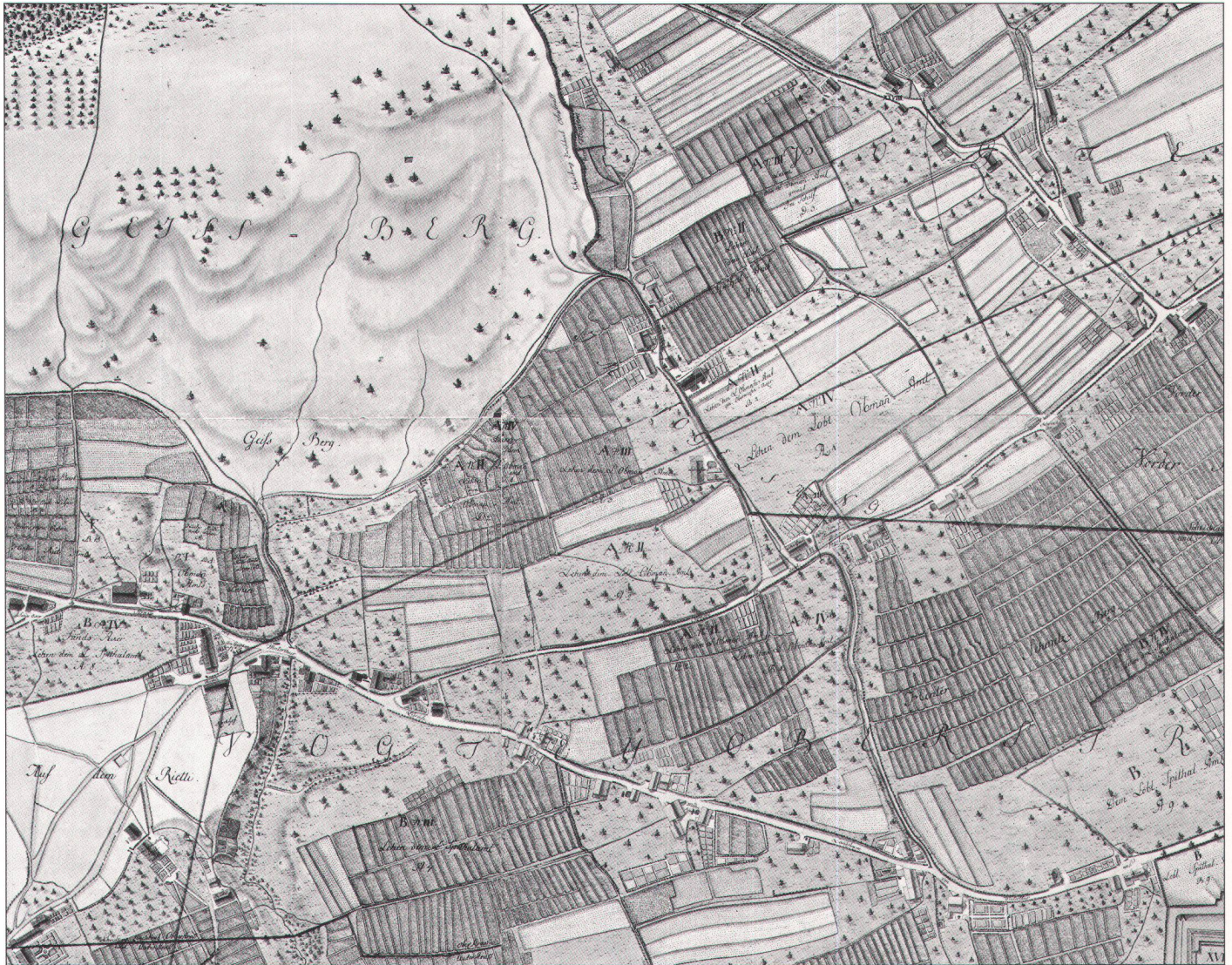
Abb. 9. «GRUND=RISS der STADT ZÜRICH» von Ing. Johannes Müller, 1788–1793. Ausschnitt verkleinert auf ca. 15%. (Original: Baugeschichtliches Archiv der Stadt Zürich).