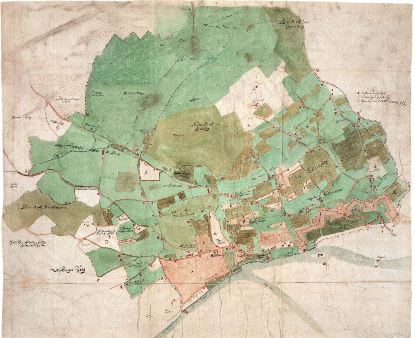
Abb. 2. Flunterer Zehntenplan von Hans Rudolf Müller, 1682. Ca. 1:6250, Format 61,5 x 51,2 cm (Staatsarchiv Zürich).

Wie aus dem Verzerrungsgitter (Abb. 3) hervorgeht, ist das auf dem Flunterer Plan abgebildete Gebiet für die damalige Zeit erstaunlich genau vermessen worden. Gute Dienste zur Konstruktion des Verzerrungsgitters leistete ein Stadtplan im vergleichbaren Massstab 1:7500, aufgenommen 1867, in einer Zeit, in der die Überbauung eben begonnen hatte. Auf dieser modernen Karte wurde