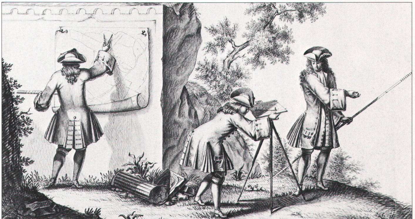
Abb. 1. Vermesser an der Arbeit (Staatsarchiv Zürich).

Das Almosenamt hatte einzelne Rebparzellen, die inmitten des Flunterer Zehnten des Stifts zum Grossmünster lagen, und deren Abgaben man Zollzehnten nannte. Von einzelnen Stücken musste der Besitzer die Hälfte des Zehntenweins dem Almosenamt, die andere Hälfte dem Grossmünsterstift abliefern. Weil immer wieder