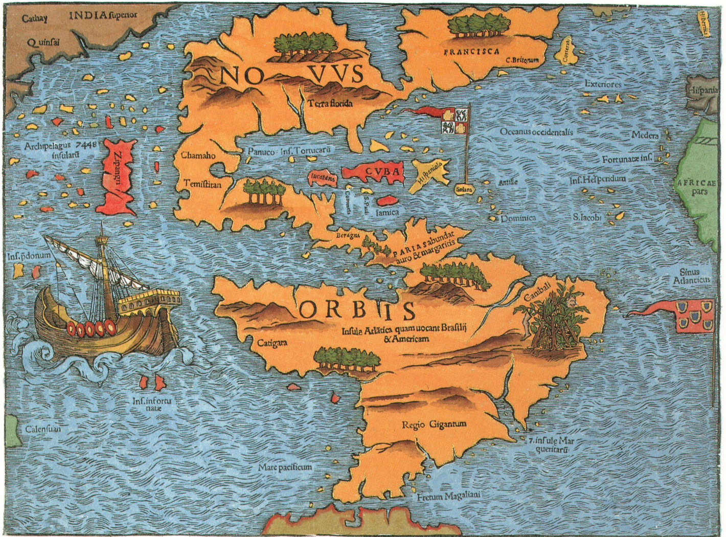
Abb. 4. Amerika-Karte von Sebastian Münster, aus «Geographia Universalis», Basel 1540 (Faksimile). Bildformat 35 x 26 cm.

(im Atelier von László Vincze ) und die Druckfarbe speziell hergestellt. Das sehr markante Wasserzeichen «Cartart» soll verhindern, dass die neugedruckten Karten mit den Originalen verwechselt werden. Auf der Kartenrückseite wurde der lateinische Originaltext mit der entsprechenden Seitenzahl 45 ebenfalls im Hochdruckverfahren beigelegt (Abb. 3).