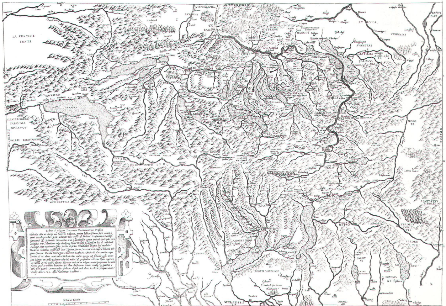
Ausgabe von Luchino, 1566. Format 57 x 40 cm. Vincenzo Luchino war von 1544 bis 1568 ein bedeutender Verleger von geographischen Karten, in Rom und zeitweise auch in Venedig tätig.

Das deutschsprachige Heft im Format A4, 16 Seiten mit 7 einfarbigen Abbildungen und 1 Diagramm kostet sFr. 15.- (inkl. Versandkosten Schweiz). Bezugsquelle: Verlag CARTOGRAPHICA HELVETICA, Untere Längmatt 9, CH-3280 Murten