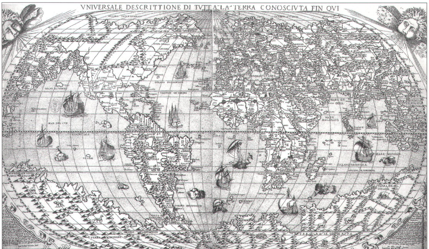
Mappemonde de Bertelli, 1565. (Abb. aus «L'empire des cartes»).