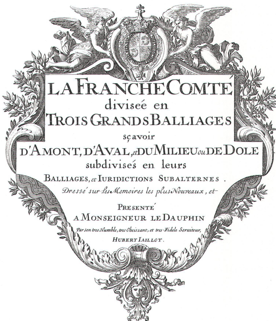
Abb. 1: Titelkartusche der Karte des französischen Juras La Franche Comté von Alexis-Hubert Jaillot (Ryhiner-Sammlung, StUB Bern).

Jaillot bildet ein gutes Beispiel für einen kommerziellen Kartenproduzenten. Er war ursprünglich königlicher Bildhauer, bevor er in das Kartenverlagswesen einheiratete. Mehr als die Hälfte der Karten, die er in der Folge publizierte, tragen Widmungen. Nach dem Tod seines Schwiegervaters Nicolas Berey I (1665) und seines Schwagers Nicolas Berey II (1667) erbte Jaillot deren Lager an Karten und Kupferplatten. Einige Jahre später (1670) begann er florierende Geschäftsbeziehungen mit den zwei Söhnen von Ni-